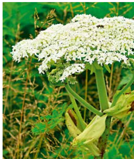
Bild: Ein Riesenbärenklau in voller Blüte – Kontakt unbedingt vermeiden!

Wir werden die Pflanze fach- und ordnungsgemäß entfernen.